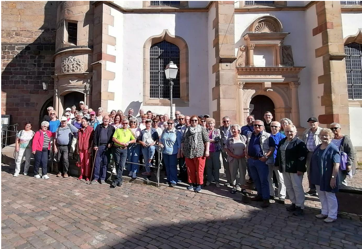
Die Reisegruppe nach Ankunft in Freinsheim

Am vergangenen Samstag, 08.06.2024, fand unser Vereinsausflug in die Pfalz statt. Nach mehreren Jahren Pause, hat sich die MGV Familie endlich mal wieder auf einen gemeinsamen Tagesausflug begeben. Mit einem Doppelstockbus machte sich am frühen Morgen eine Gruppe von 70 Personen, bestehend aus Sängerinnen und Sänger mit ihren Angehörigen, passiven Mitgliedern und Freunden des Vereins auf den Weg vom Treffpunkt an der Ertenthalhalle in die schöne Pfalz. Zunächst ging es nach Freinsheim, das mit seiner wunderschönen historischen Altstadt, der Stadtmauer und mit idyllischen Gassen und Plätzen zu einem der schönsten Orte an der Deutschen Weinstraße zählt.